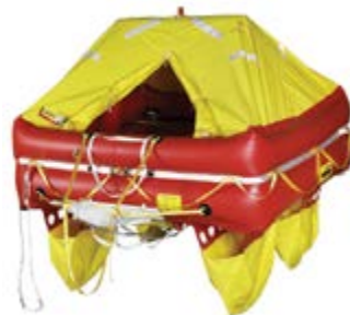
OPEN SEA ISO 9650 HAUTURIER Nb de places : 4-6-8-10