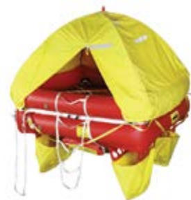
COASTER ISO 9650 CÔTIER Nb de places : 4-6-8